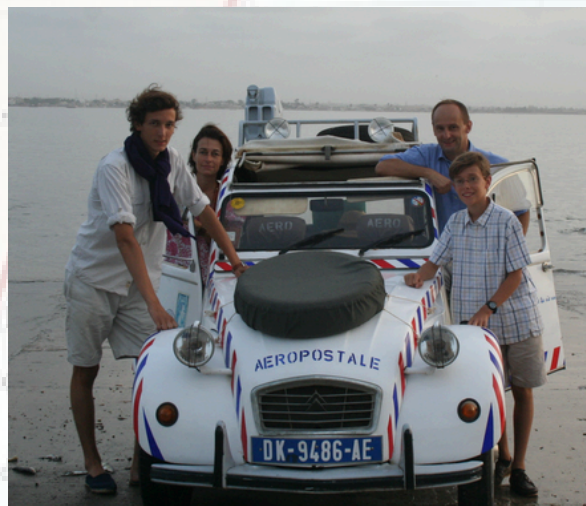
Point zéro à Dakar en juillet 2009, depuis le hangar des hydravions à Bel Air